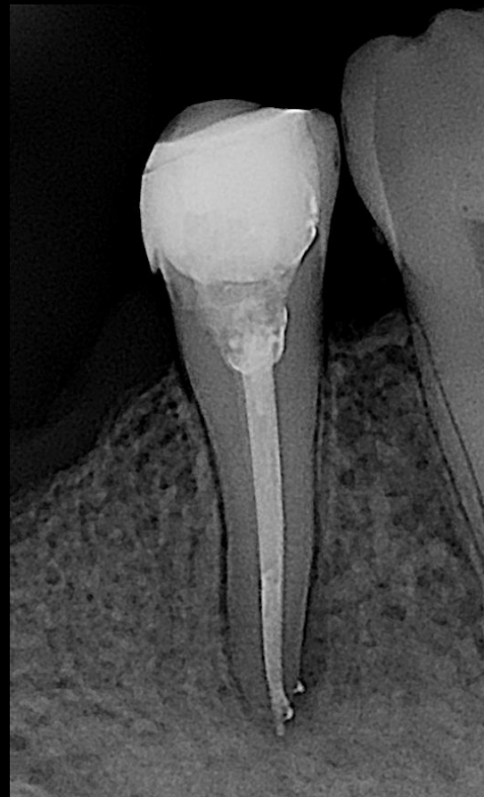
Fig. 2 - Tratamento endodôntico