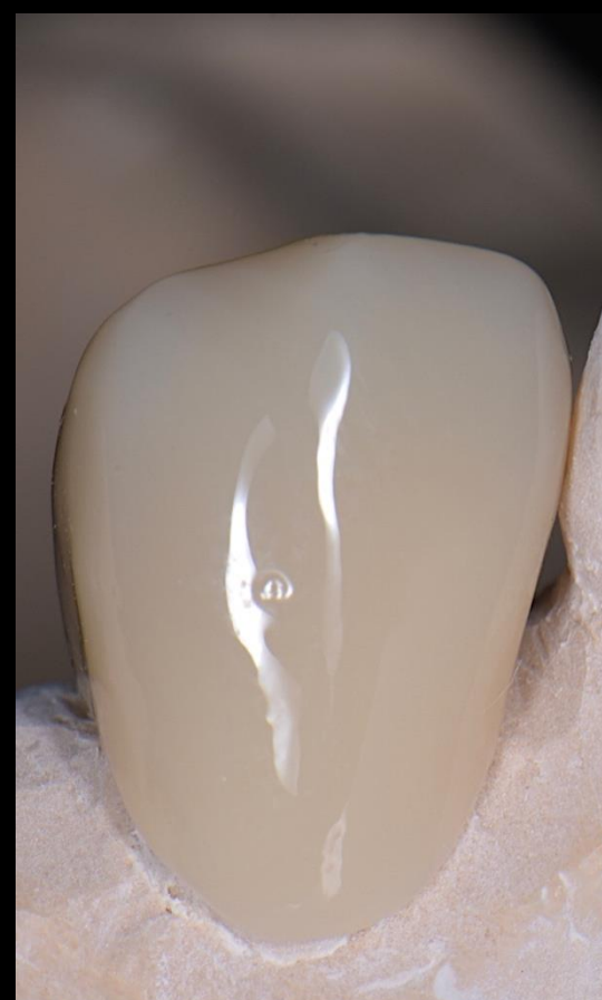
Fig. 7 - Prova de infraestrutura em PMMA