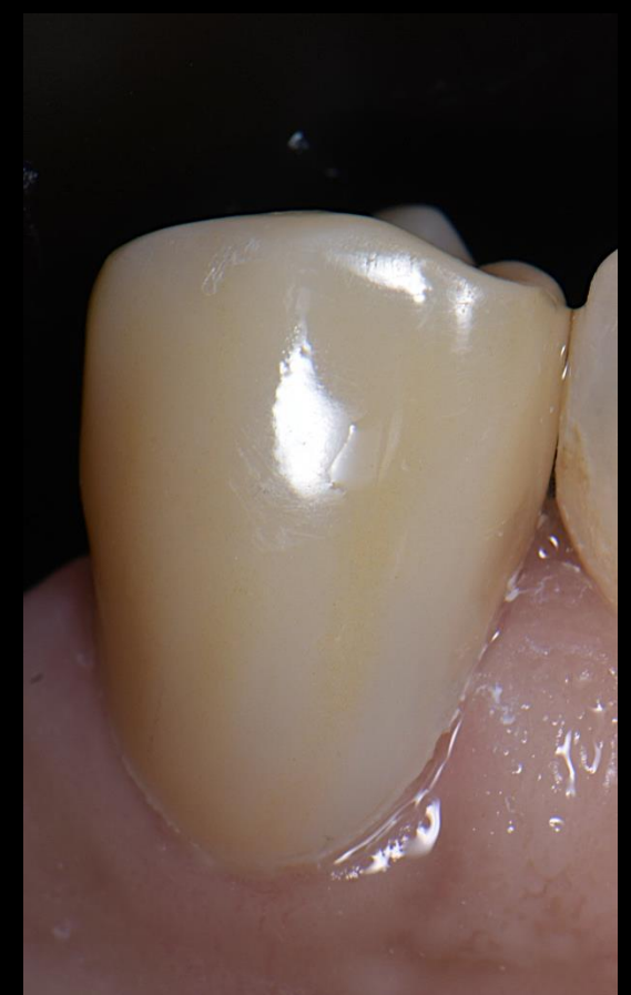
Fig. 8 - Fotografia intra-oral final dente #44