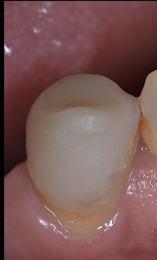
Fig. 3 - Colocação do espigão e confecção do núcleo