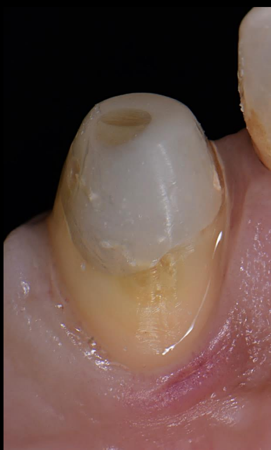
Fig. 5 - Tecidos cicatrizados 15 dias após o preparo