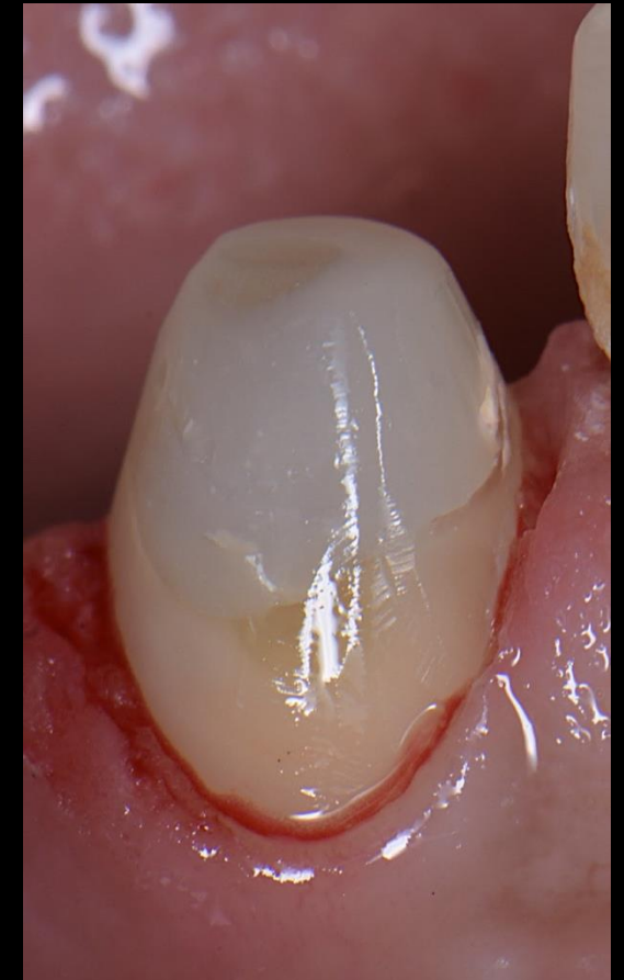
Fig. 4 - Preparação vertical