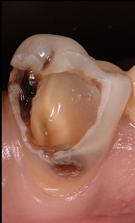
Fig. 1 - Fotografia intra-oral inicial dente #44

Após o retorno, realizou-se a prova de infraestrutura em PMMA, a qual apresentou correta adaptação marginal e espessura de material, e procedeu-se à seleção da cor. Dessa forma, foi reenviada ao laboratório. A prova de cerâmica foi realizada e, ao entregar naturalidade aliada à função, avançou-se para a cimentação da coroa cerâmica final em dissilicato de lítio com um cimento auto-adesivo resinoso. Foi realizado o registo oclusal e os devidos ajustes, e removidos os excessos de cimento.