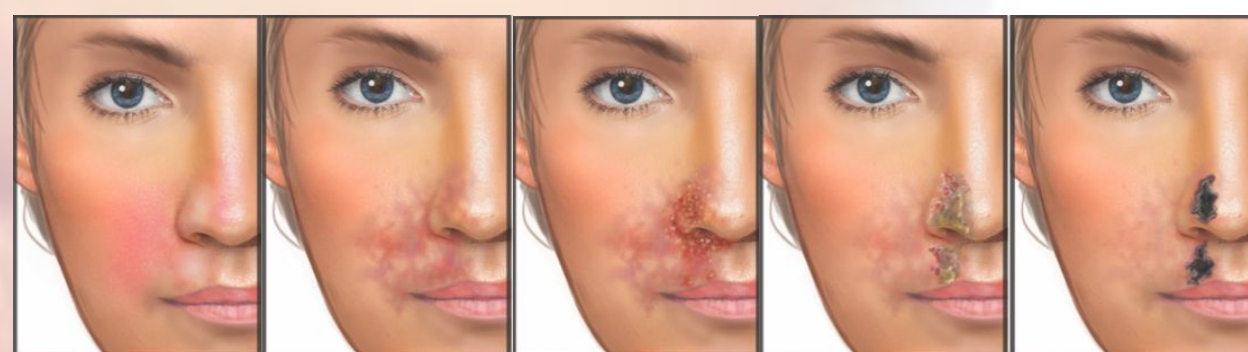
Fig. 3 - Fases cutâneas da oclusão vascular