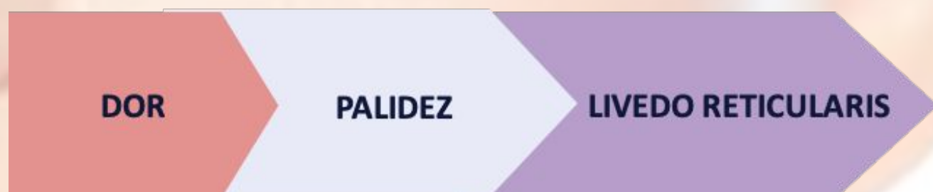
Fig. 2 - Sintomatologia da oclusão vascular