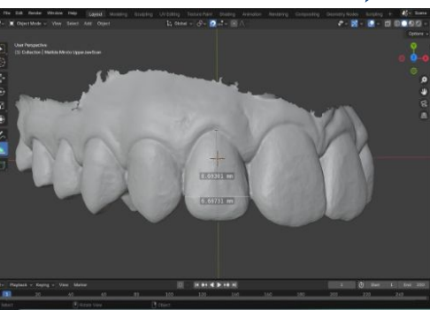
Fig. 1 - Medição da altura e largura da coroa de cada dente