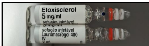
Fig.1 – Lauro macrogol 400 utilizado em escleroterapia