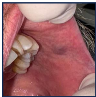
Fig. 4 – Pós-op 1 mês