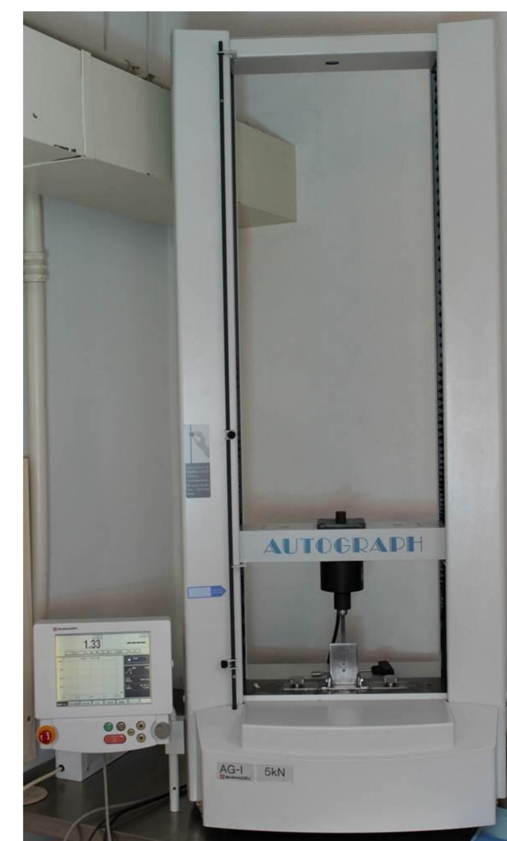
Imagem 2 – Shimadzu AG-1 5kN testing instrument